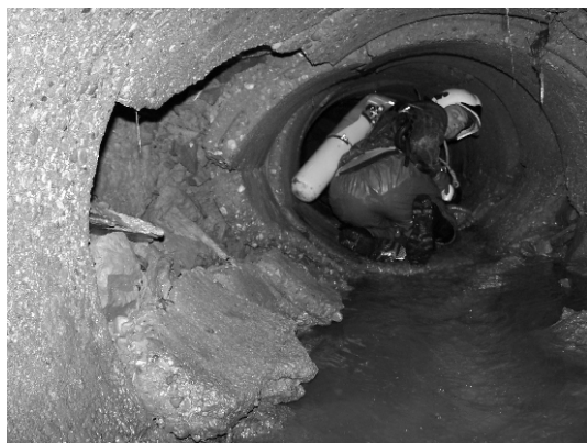
Zborčené skruže

Doloplazské podzemí, alespoň co já víím, není tak historicky či technicky zajímavé, jako podzemí některých našich metropolí, přesto mě však zajímalo „jak to tam je“. Už v minulém zastupitelstvu na toto téma občas přišla řeč v souvislosti s plánovanou opravou kanalizace. Pravidelně potom, vždy když se přes naši obec přehnala „velká voda“, valila se po cestě a vytékala z kanálů, se téma probíralo v různých místních odborných kruzích, u Zatloukalů počínaje a u Fraitů konče. V souvislosti s vypracováním projektové dokumentace na odkanalizování obce, která je zadána zhotoviteli, se skutečným stavem naší páteřní kanalizace zabývalo i současné zastupitelstvo. Vždy jen však do doby, než se začalo hovořit o tom, kolik by stálo jeho zdokumentování u